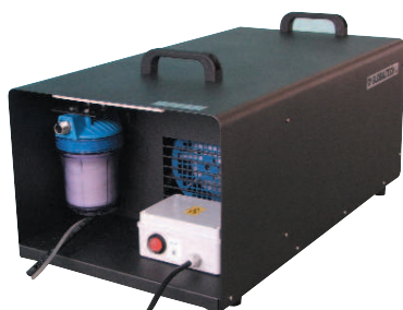
Box pompa protetto